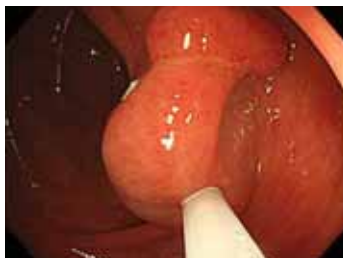
① ポリープにワイヤーをかける

内視鏡的ポリペクトミーで切除されたポリープは、すべて回収され、病理医による組織検査が行われます。ポリープの性状、がんの有無などを調べ、その後の方針を決定します。ポリープが切除されても、未回収に終わり、病理検査が行われなければポリープ切除に意味がないといつても過言ではないのです。