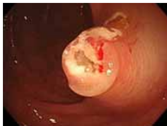
② 電流を流して切除