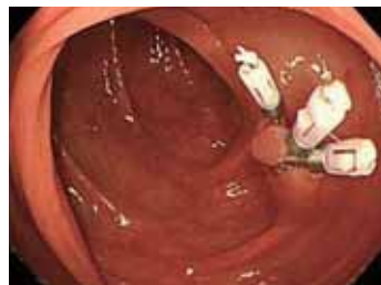
③ 止血予防でクリップ