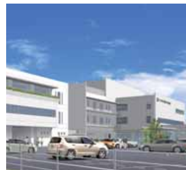
【表紙】建築パース提供 KUMESSEKKEI

「診療編」についておはなしします。 次号では、開設50周年に向かう挑戦の効果があつたのだと思います。 いよいよ増築工事が始まりました。「患者さん満足」と「職員満足」がこれからのより良い医療の提供には欠かせません。 医療を取り巻く環境は、厳しさを増すばかりですが、だからこそ、将来を見据えた積極的な投資はプラスの効果があるのだと思います。